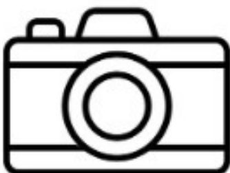
Foto des Typenschils und des Antragsformular machen und per WhatsApp senden an 0031 655 187 118